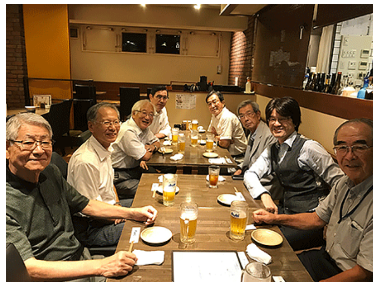
セミナー終了後講師を囲んでの懇親会