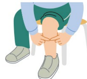
② 利き足ではない方のふくらはぎの一番太い部分に当てる