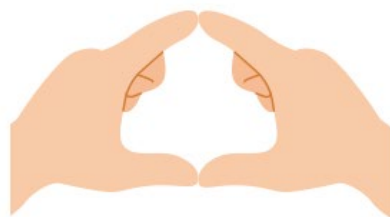
① 両手の親指と人差し指で輪を作る