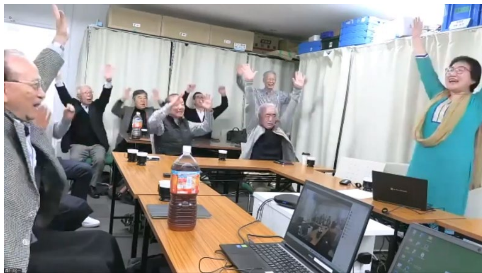
リアルセミナー風景（2024年笑いヨガ）